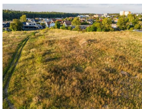
Současný stav místa, kde vyroste projekt Nová Cihelna Kladno

Okolní příroda a sportovní areály skýtají možnosti pro rozmanité aktivity. Pro pěší nebo cyklistické výlety se nabízí přírodní park Džbán, Turyňský rybník, přírodní rezervace Pašijová draha, Hradiště Libušín a mnoho dalších. Pro sportovní aktivity jsou zde k využití například Městský stadion Sletišť, fotbalové hřiště, Aquapark Kladno, zimní hokejový stadion a hokejbalová aréna, sportovní hala BIOS, tenisový klub, jízdárna, lanový a trampolínový park či inline dráha.